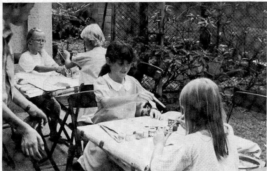
Taschenbemalen für Kinder