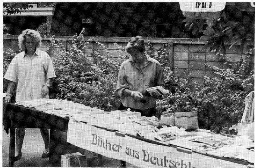
Bücher aus Deutschland