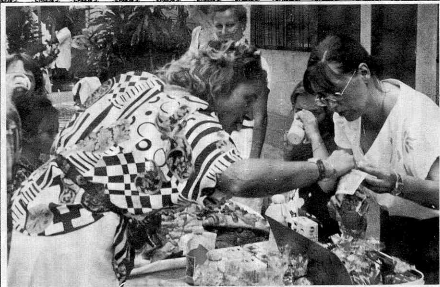
Selbstgebackenes wechselt den Besitzer