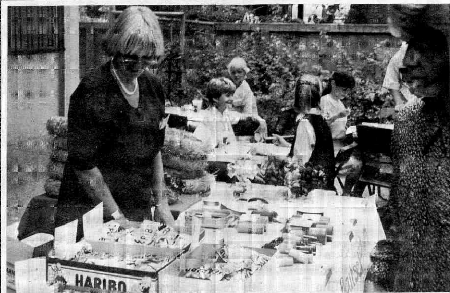
Süßes und Adventskränze